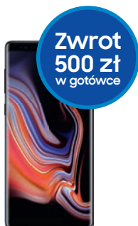
Galaxy Note 9