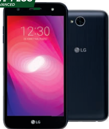
LG X Power 2