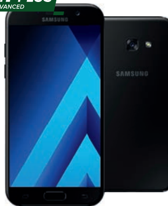
Samsung Galaxy A5 (2017)