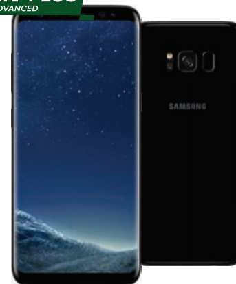
Samsung Galaxy S8+