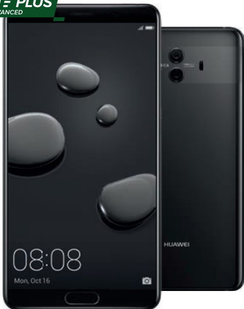
HUAWEI Mate 10 Pro