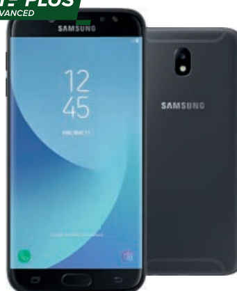
Samsung Galaxy J7 (2017) Dual SIM