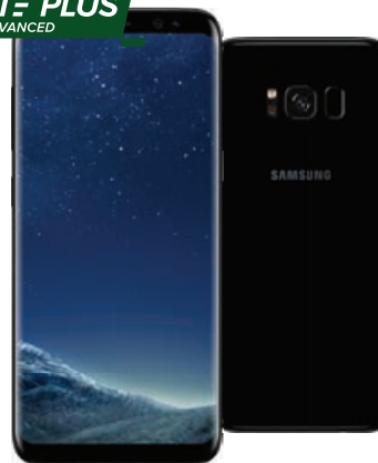
Samsung Galaxy S8