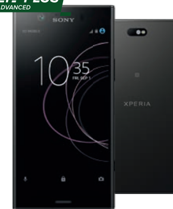
Sony Xperia XZ1 Compact