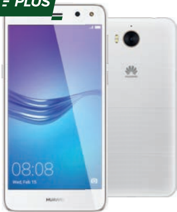
HUAWEI Y6 2017