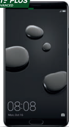
HUAWEI Mate10 Pro